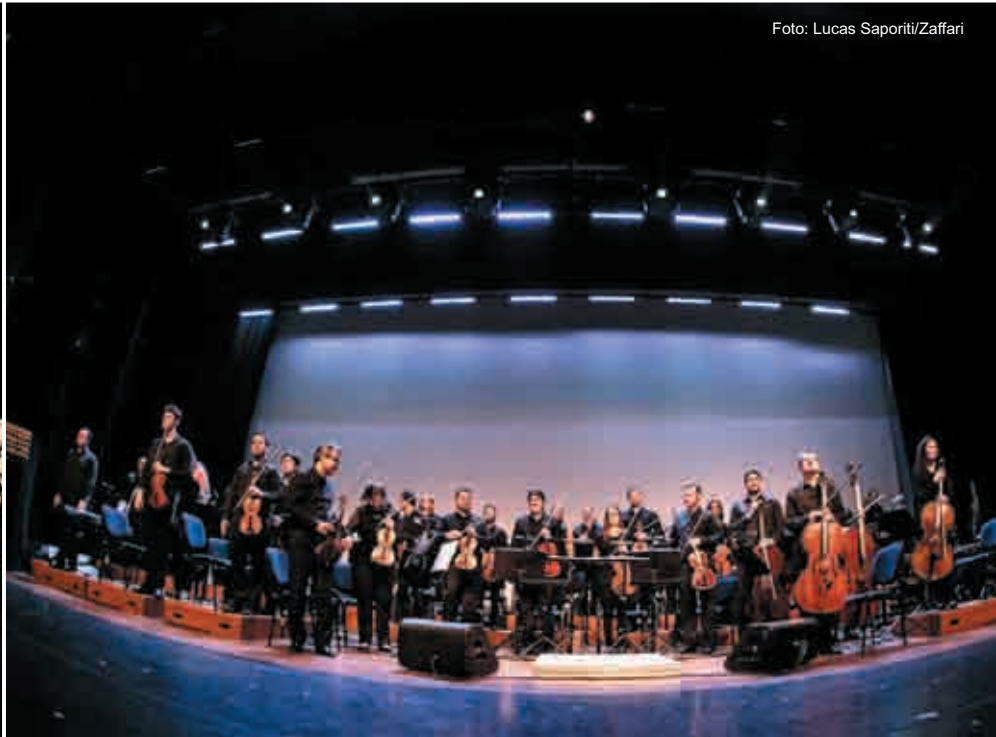
Concertos Comunitários e Grupo Tholl: Grandes espetáculos na Feira do Livro Infantil