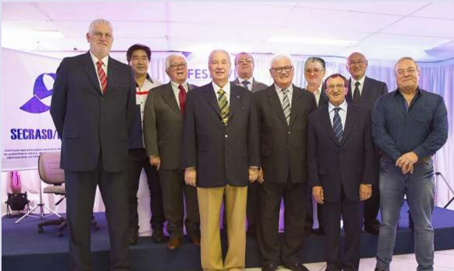
Convidados especiais prestigiaram posse da diretoria da Feservi-Sul

Nos dois dias seguintes, os visitantes dividiram-se na programa-