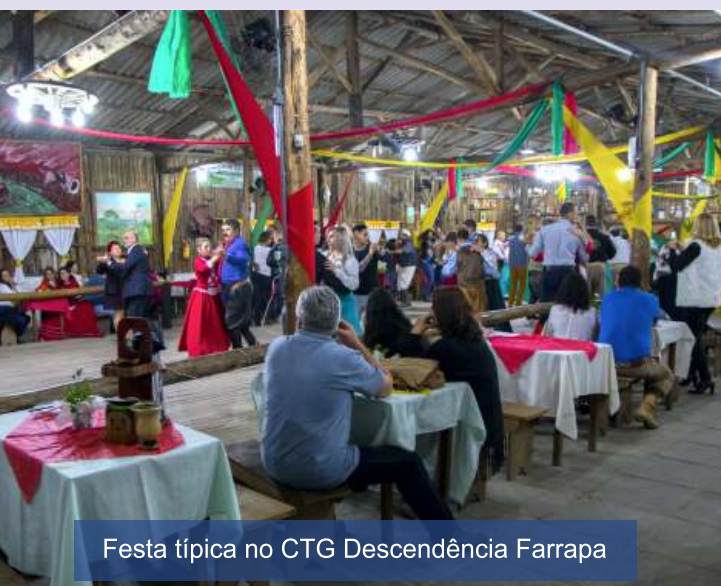
Festa típica no CTG Descendência Farrapa