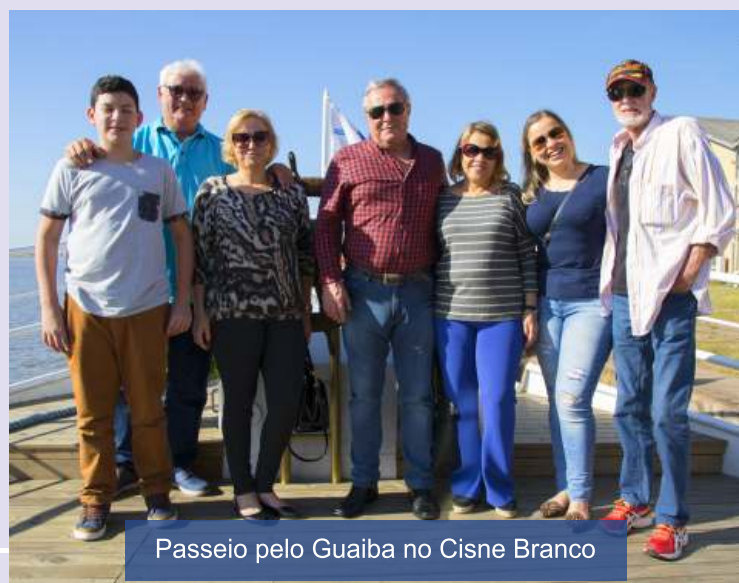
Passeio pelo Guaíba no Cisne Branco