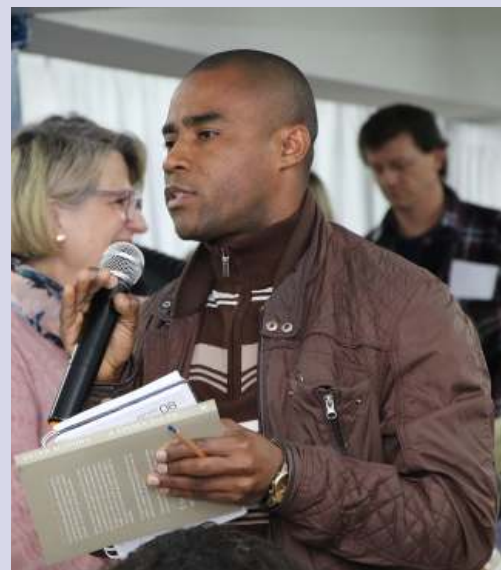
Lideranças nas áreas educacionais e de assistência social manifestaram preocupações