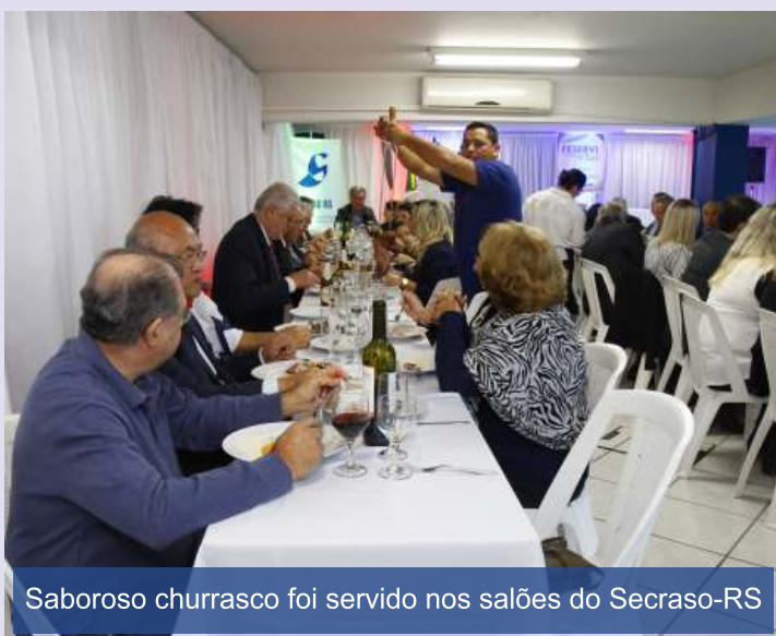
Saboroso churrasco foi servido nos salões do Secraso-RS