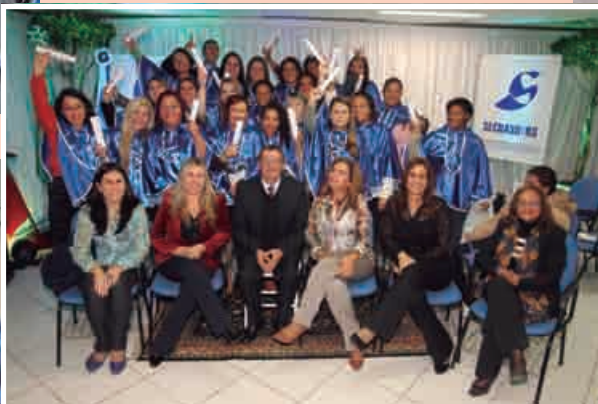
Mestres e formandos confraternizaram após entrega de diplomas à segunda turma do Curso de Educador Assistente, promovido pelo Secraso-RS