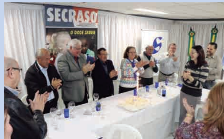
Um grande e afinado coral cantou Parabéns a Você pelos 45 anos do Secraso-RS