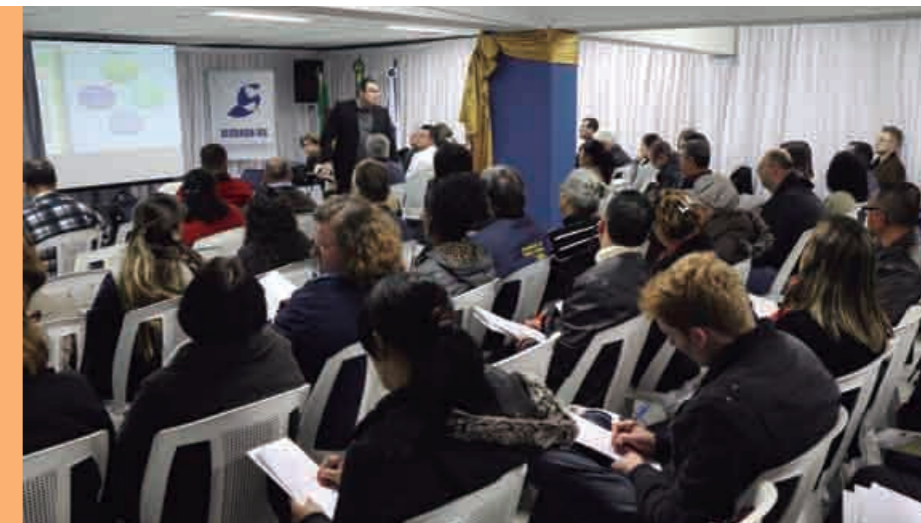
Enormes plateias compareceram às palestras realizadas em Porto Alegre e na cidade de Panambi/RS

rias previstas na lei nº 8.212, de 24 de julho de 1991, e de rendimentos pagos por si sujeitos à retenção na fonte. Segundo o Governo Federal, o objetivo é viabilizar a garantia de direitos previdenciários e trabalhistas aos trabalhadores brasileiros, simplificar o cumprimento de obrigações e aprimorar a qualidade de informações das relações de trabalho, previdenciárias e fiscais. Contudo, na prática o sistema E-social vai impor às empresas, seja qual for o seu tamanho, uma forte e irreversível