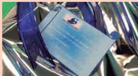
Homenagem de reconhecimento aos 22 vitoriosos