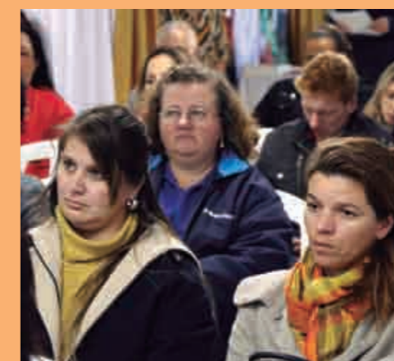
Atento, o público assimilou importantes ensinamentos

vel mudança de cultura no que diz respeito aos procedimentos internos de administração de pessoal, contratação de mão de obra terceirizada, saúde e segurança, entre outros. E essa mudança implicará também numa melhor comunicação entre os setores envolvidos na dinâmica da elaboração dos arquivos. Algumas empresas estão demonstrando preocupação apenas com a questão