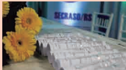
Diploma: decisivo passo para a conquista de mercado