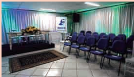
Salões do Secraso ambientados para a solenidade